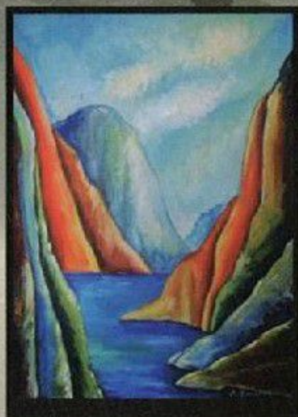
Зоран Б Лековић