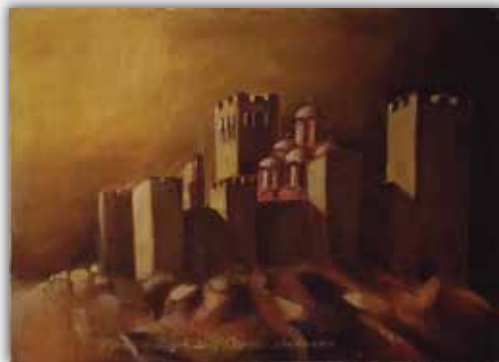
Милутин Дедић Порекло светлости