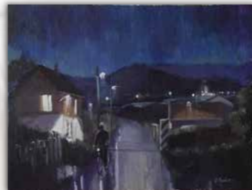
Бранко Маравић Кишни ноћурно