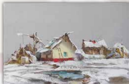
Војин Тишма Пејзаж