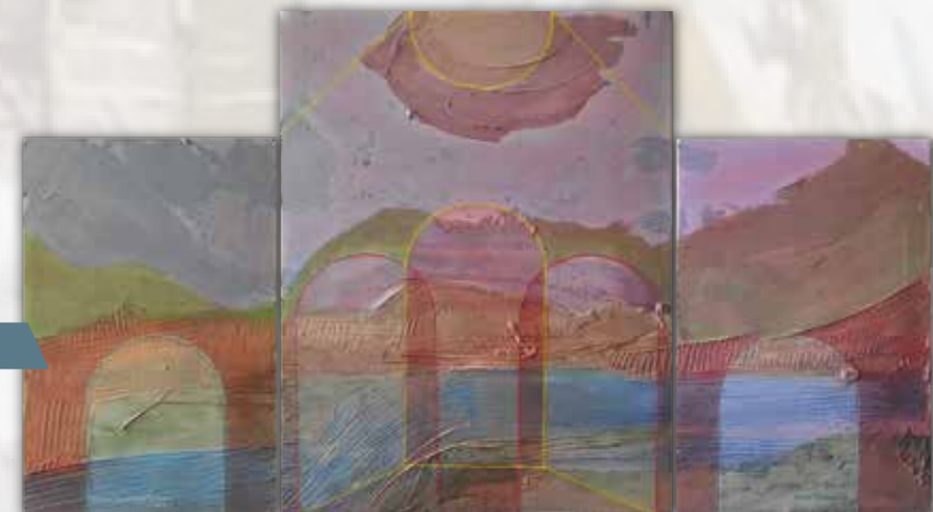
Ћуро Лубарда Дринска сновиђења