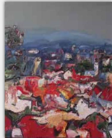
Зоран Сувајац Мачва