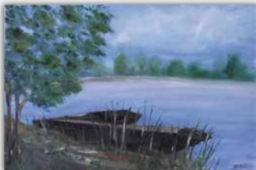
Драгана Рис Без назива