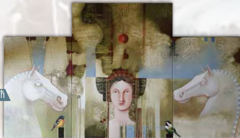
Срећко Здравковић Без назива